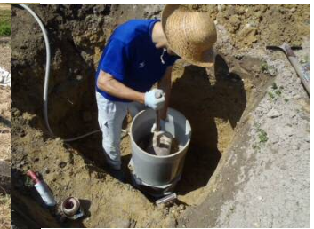
平成 28 年 砂質土野菜畑における養分動態調査用のキャピラリーライシメーターの設置