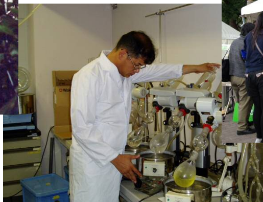
平成 16 年 農作物からの残留農薬の抽出作業