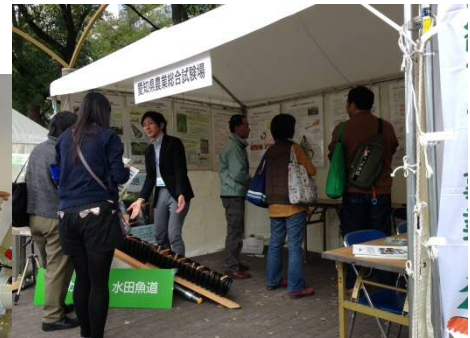
平成 26 年 ESD での環境安全研究室の研究成果展示