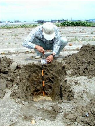
平成 11 年 碧南タマネギ畑の土壌調査