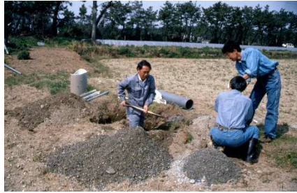
平成 5 年 水田の浄化機能調査用の井戸掘り作業