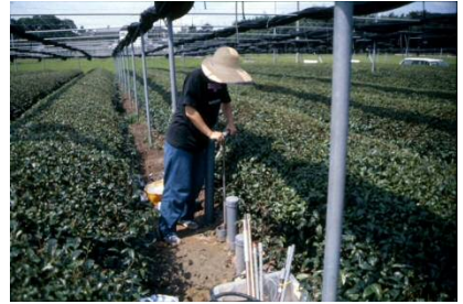
平成 10 年 茶園地下水調査用の井戸掘り作業