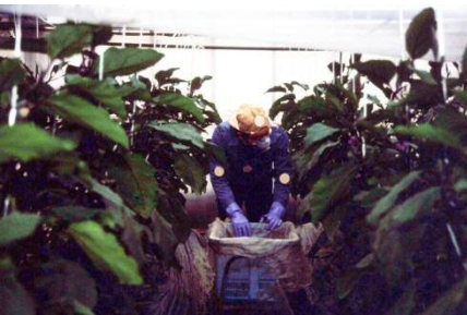
平成元年 収穫作業時の農薬暴露量調査