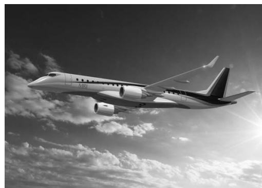
MRJ 完成予想図