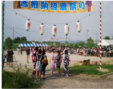
チラシ・ロック手渡し配布の様子