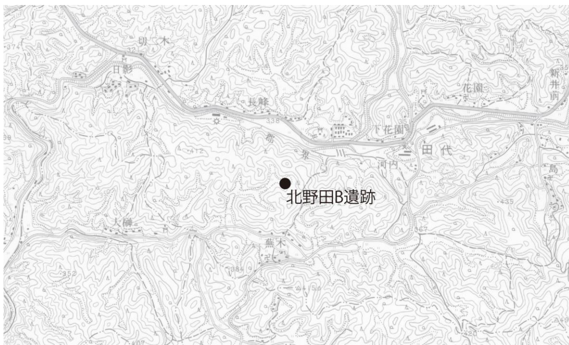
国土地理院 1/2.5 万 地形図「東大沼」