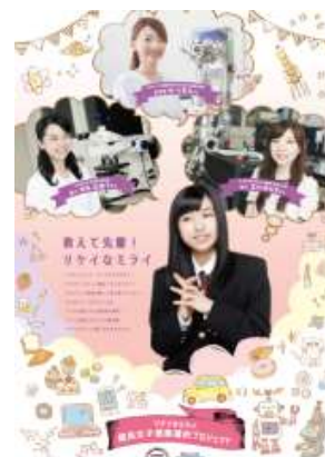
理系分野への進路選択支援啓発資材の作成（H28）

経済の基盤であるモノづくり産業を支える人材の確保・育成は国をあげての急務であるため、女性技術者等の育成支援が強く求められる。