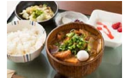
蔵カフェランチ (豊橋)