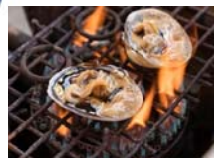
焼き大アサリ (蒲郡)