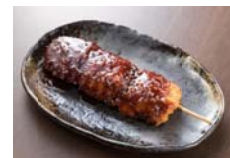
八丁味噌串カツ (岡崎)