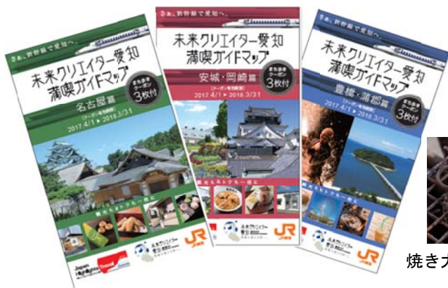
【ガイドマップ表紙】