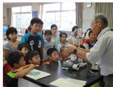
ストップ温暖化教室