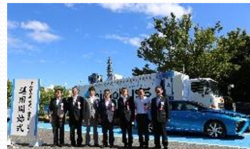
県庁移動型水素ステーション運用開始式