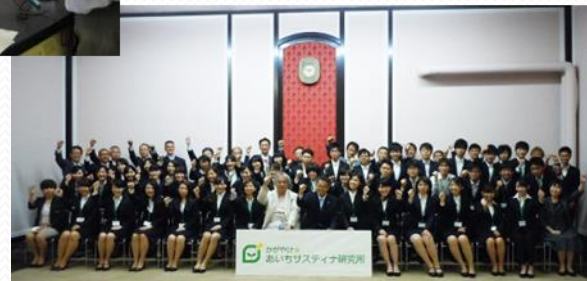
かがやけ☆あいちサスティナ研究所