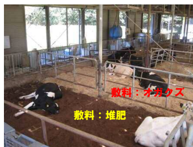
図3 敷料向け堆肥の生産と牛の敷料としての再利用