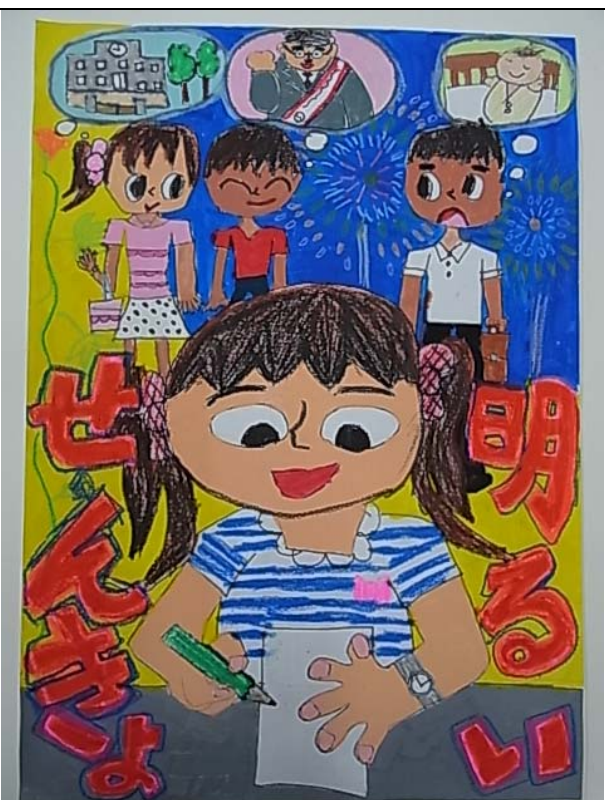
一宮市立三条小学校 3年