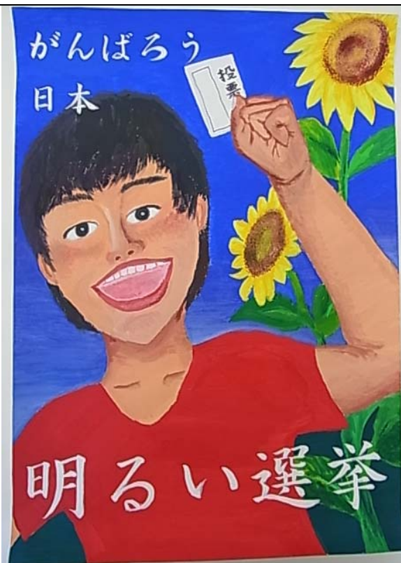
田原市立東部中学校 1年