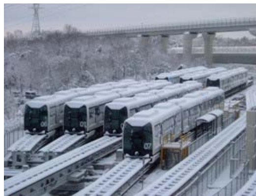
東部丘陵線（リニモ）