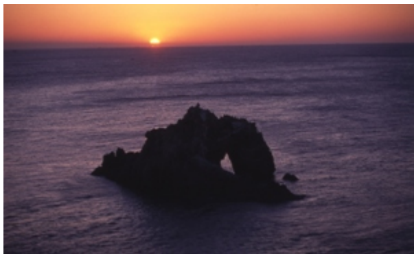
田原市 日出の石門