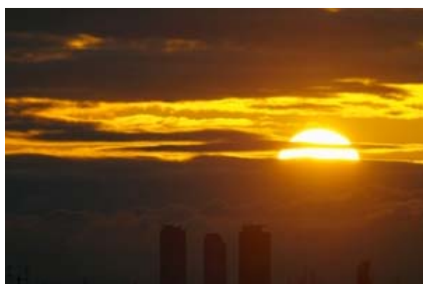
JR セントラルタワーズを前景に