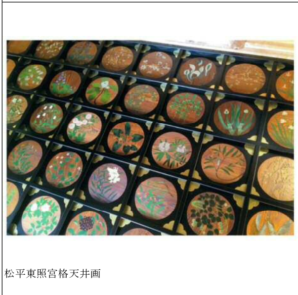
松平東照宮格天井画