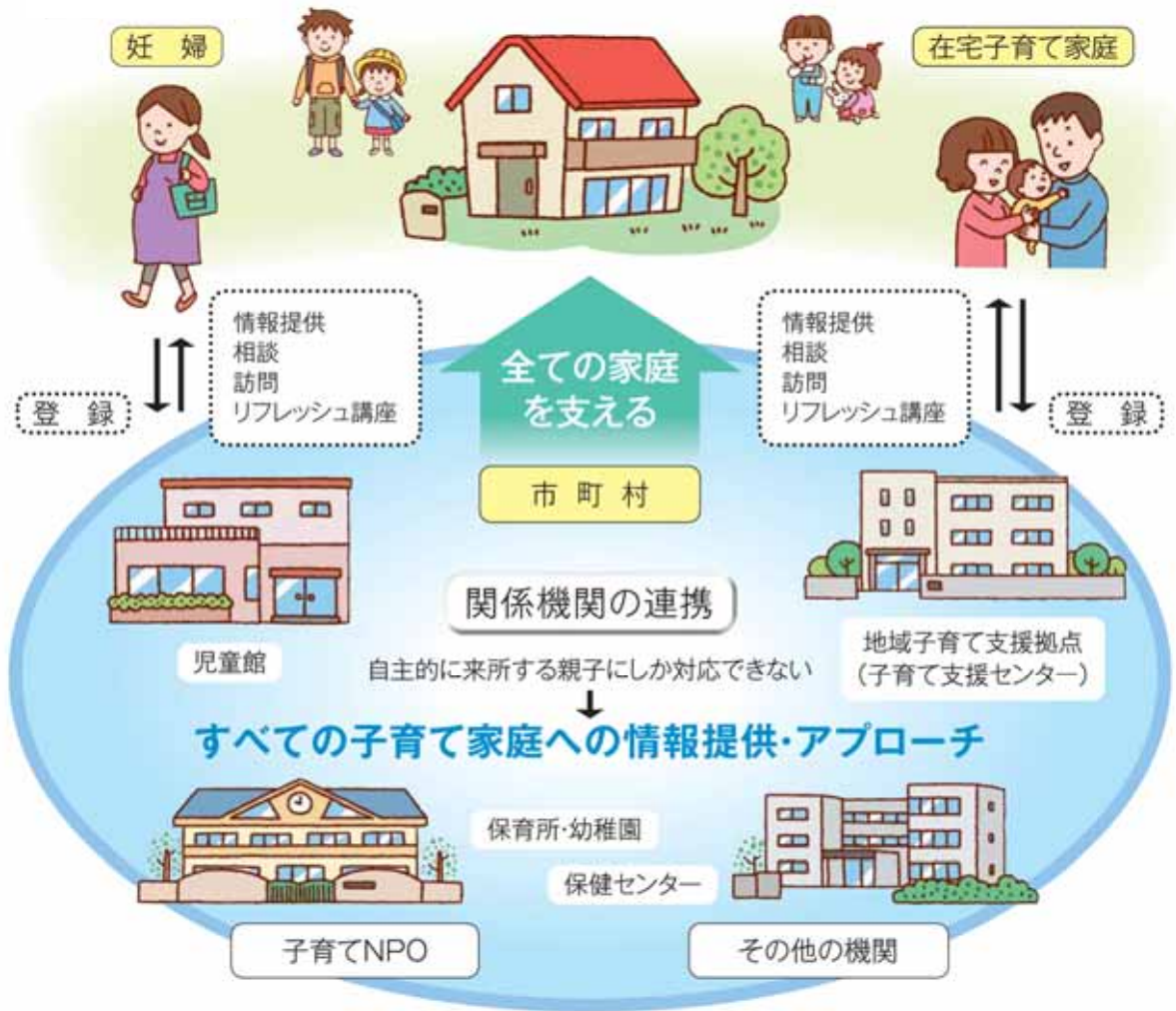
子育て情報・支援ネットワークの仕組み(図 24)