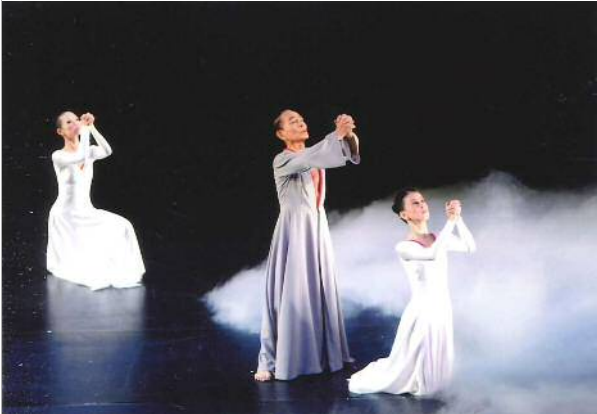
「祈り」 平成20年9月 愛知県芸術劇場小ホール

平成11年舞踊生活50周年記念公演 ハワイ・ロスアンゼルス・シドニー・南京・上海・メキシコ親善公演 平成29年「米寿の会」公演