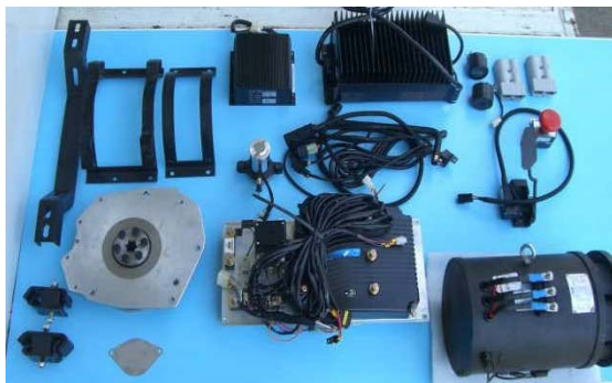
EV コンバートキット

今後は、全国で 500 社の会員を作ることを目標として、勉強会を開催するほか、フォーラムへ EV コンバート車を出展するなどの PR 活動を行うことを予定している。