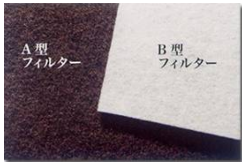
選択制消臭フィルター

同社は、2012 年には、愛知県農業総合試験場との共同研究を進め、畜産農家の近隣地域の悪臭対策に向け、さらに試験、改良を重ねる計画。現在は、養鶏、養豚など、畜産農家を中心として販路を拡大しているが、消臭の需要は幅広く、公衆トイレ、動物園、ペットショップ、病院及び介護施設、レストラン厨房など、様々な分野での市場開拓が期待されている。東日本大震災では、避難所でのトイレの悪臭が問題化したが、同社は、被災地支援として、宮城県南三陸町に同製品を無料配布した。