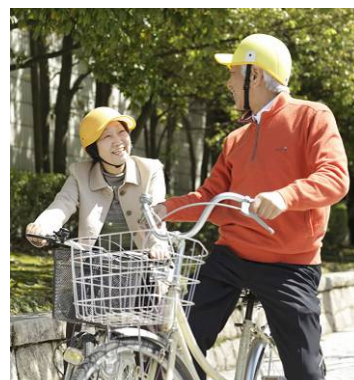
【安帽】選べるカラーバリエーション 12種類

同製品開発の背景には、ヘルメット未着用が原因の一つとされる、高齢者の自転車転倒による死亡事故の増加がある。既存のヘルメットは、普段着に合わないといった意見が多く、ヘルメットを被らず自転車に乗車して、事故発生時に、頭部損傷を受けているのが実態である。同製品は、合成樹脂に布生地を被せた野球帽のようなデザインで、インナーは取り外して丸洗いが可能。生産には、同社の主力製品である金型が活用され、それまで自動車部品の金型製作に使われたSPモールドの表皮材貼合プロセスが合成樹脂と布生地の貼合に流用された。通常の帽子より頭部を保護する能力があり、軽量かつファッション性を備え、着用しやすい。無帽時と比べると、64%の衝撃を吸収するため、自転車乗車時に限らず、登山やウォーキング時の転倒による負傷防止にも効果が期待できる。さらに、2011年には、東日本大震災を受け、防災用の安全帽子の製造、販売を開始した。今後は、防災用帽子としての販路の拡大、高齢者だけでなく、子どもにも適した商品の開発を計画している。