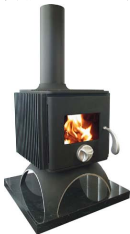
森守(もり)のストーブ「Lin」

鋳造のモデリングでは、業界に先駆けて、1999年から3DCADを導入し、鋳造業における活用を模索。2010年から、本格的に3DCAD事業を開始し、3Dデータを用いた鋳物設計をサポートするなど、IT技術も活用している。