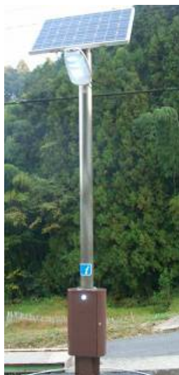
「街灯 明(あきら)くん」 ソーラー充電式エコ LED 照明灯

愛知県豊田市で自動車部品を製造している市川工業有限会社は、溶接や組み付けの技術を有し、シャシーやシートの子組みの製造に携わってきた。同社は、リーマンショック以降、受注の激減に対応するため、自動車部品製造で培った溶接の技術を活かして、独自製品の開発、販売に着手し、自社製品や技術のPRに本格的に取り組み始めた。