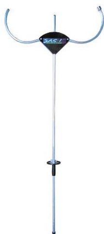
護身用具サスマタ「サスケ」

同社は、早くから海外進出に取り組み、1989年にフィリピンで技術援助を行ったことを皮切りに、中国、タイ、フランスの3カ国5拠点に工場等を設立。現地の日系自動車メーカー、欧米企業や現地企業に対し、製品を供給している。2010年には、インドへも展開し、現地自動車部品メーカーとの合弁で新工場を設立することを決定した。日系自動車メーカーだけでなく、成長著しい新興国の自動車メーカーとのパイプも太い。