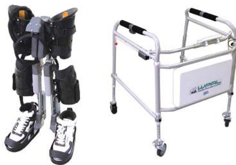
歩行補助ロボット WPAL

医療分野では、藤田保健衛生大学等との共同開発で、下肢麻痺者用の歩行補助ロボットWPALの実用化に着手。これは、脊髄損傷により下肢麻痺となった車いす利用者が、車いすからの起立と平地歩行を快適に実現するためのロボット。従来の歩行装具は装着が困難であったり、車いすとの併用ができない、歩行時の上肢の負担が大きいなど、問題が多かった。しかしWPALは、車いすに座ったまま装着でき、各関節にモーターを付加したパワーアシストにより、患者の負担の少ない歩行が可能になった。2012年には、製造、販売を開始し、病院やリハビリ施設での実用化を目指している。