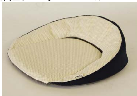
仙骨サポート座布団

近年は、自動車以外の分野にも進出。自動車用シートの開発で培った技術を活かし、早稲田大学発ベンチャー企業として設立された東京都新宿区のエルゴシーティング株式会社と共同で、「仙骨サポート座布団」を開発。同社が開発・デザインを担当し、エルゴシーティングが仙骨サポートの理論と実験の指導を行った。「仙骨サポート座布団」は、座ることで良い姿勢を保ち、長時間椅子に座っても疲れないのが特徴。姿勢が悪いと、骨盤が後傾して仙骨に痛みが生ずる。同製品は姿勢を正し、仙骨に体重が集中するのを防ぐ。椅子にのせて使用する同製品は、長時間座ることの多いオフィスやダイニングの椅子等に適応。椅子の高さを変える必要もなく、着座時の座り心地を向上させる。2011年6月の発売以来売れ行きは好調であり、同社では、新たな製品の開発も計画中。また、同製品の開発で得た技術や知識を、本業である自動車シートの座り心地向上にも活かしていく予定。