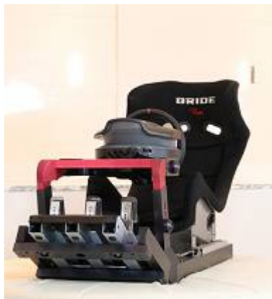
CFRPを用いたレーシングマシン

同社の新規事業として注目されているのが、「炭素繊維強化プラスチック(CFRP)」の量産加工技術の開発。炭素繊維強化プラスチックとは、強化材に炭素繊維を用いたプラスチックであり、鉄やアルミよりも軽量でありながら高い強度を持つ。ゴルフクラブのシャフトなど、スポーツ用品への応用から始まり、現在では、レーシングマシンや航空宇宙産業へと用途が広がっているが、複雑な形状にするには加工が難しく、生産性の向上が課題となっていた。