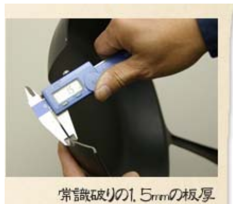
常識破りの1.5mmの板厚

同社は、国内だけでなく、ヨーロッパでも販路の拡大を進めており、将来的には、米国の調理器具販売会社とタイアップし、米国やカナダでの店頭販売も行う計画。また、同製品の製造で培った薄肉鑄造技術により、鑄物の軽量化を実現。車両部品など、軽量化が求められる分野での応用も期待されている。