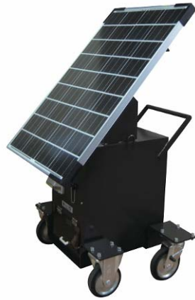
ソーラーステーション(オフロードタイプ)

愛知県名古屋市の株式会社チームエコラボは、異業種間ネットワークで技術力や販売力を補完し、環境ビジネスに参入している。中小企業が新規開拓・新分野進出を試みる場合、人材、資金、技術など様々な問題が立ちほだかることが多い。同社は、2009年に東海地区の中小企業8社の集合体からスタートし、2011年に法人化。建材の製造・販売会社や水栓業界向け樹脂部品メーカー、給排水・空調の工事会社、遠隔監視システム等の情報通信機器メーカー、自動車ライン向けメーカーなど、30社以上の多様なサポーター企業を有する。セミナーや意見