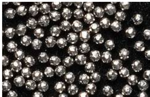
ピーニング加工用のラウンドカットワイヤー

また、胴体、タービン、主翼等にピーニング加工を採用する航空機分野への進出に取り組み、ショットピーニングの販売や、2007年からはピーニング受託加工を行っている。同社のラウンドカットワイヤーは、航空機業界でも高い評価を受け、ボーイング社を含め、大手航空機メーカーの認定を受けるなど、売上を伸ばしている。