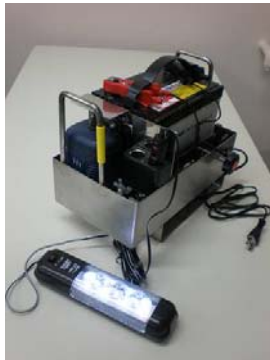
自動車のバッテリーを利用した人工呼吸器の補助電源

金型、機械部品等の設計を手掛ける愛知県大府市の株式会社アイムは、高い技術を持つ中小企業のネットワークづくりに取り組んでいる。従業員 10 人以下の企業では、専任の営業担当を置けず、発注者からのコストダウンの要求に応じて適切なコストの提案を行うことが難しい場合がある。このネットワークでは、同社が各企業の窓口となつて、発注者に対して交渉や提案を行うことによって、加工部品の設計図面から機能を把握し、より精度の高い製品を適切なコストで生産することが可能となる。現在は、ネットワーク企業の多くが携わる自動車関連の仕事とともに、医療、航空機等、他分野への参入にも積極的に取り組み、医療分野では、同市の国立長寿医療研究センター、ALS(筋萎縮性側索硬化症)協会との共同開発で、「自動車のバッテリーを使用した災害時の人工呼吸器の補助電源」を開発した。