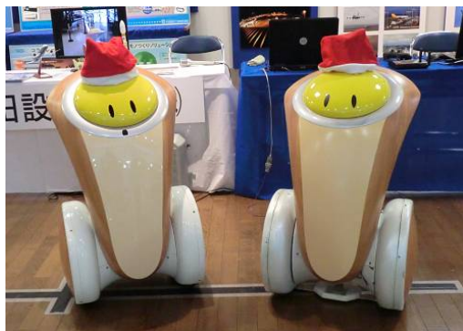
ツアーガイドロボット

また、宇宙関連では、世界的にも有数の低コストのロケットとして設計された我が国の主力大型ロケットH-IIAロケットの技術業務を担当。国際宇宙ステーションに物資を運ぶ軌道間輸送機HTVやISSに取り付けられる有人実験施設(日本初)JEM等の設計業務も従事した。