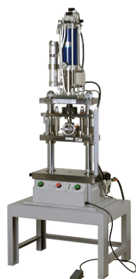
MAH型エアードロプレス

ネットワークでは、企業が5つのグループに分かれ、新規事業の検討、技術の相談、アイデアの図面化、仕事の受・発注等の活動を行っており、設計から加工・組立までの一貫体制が構築されている。また、活動の一環として、相互に製造現場を見学し、個々の企業が有する設備、ノウハウの開示を行い、情報の共有を図る取組が行われている。こうした取組によって、一社では設備や技術の不足で断らざるを得なかった受注案件を、他の加盟企業に相談、紹介し、ネットワークとして、仕事を確保している。東日本大震災の復興支援では、加盟企業が協力して被災した工場へ機械の提供を行うなど、新たな社会支援活動も行われた。