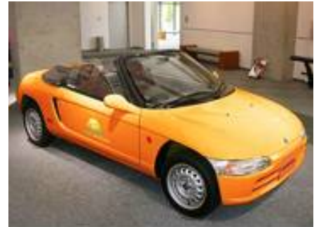
コンバージョン EV のデモカー

イービー愛知株式会社 代表者:伊藤勝規 〒460-0011 愛知県名古屋市中区大須 4-2-9 電話 052-241-2600 http://www.ev-aichi.jp/