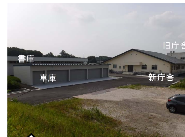
【 写真 - 1 】 新庁舎(今回完成)