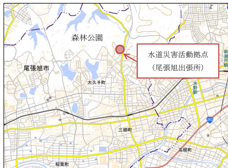
【 図 - 1 】 位置図