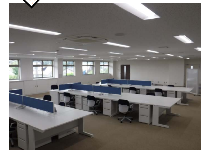
【 写真 - 3 】 出張所事務室(今回完成)