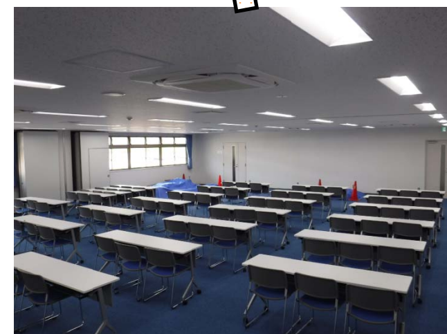
【 写真 - 2 】 応援者宿泊スペース(今回完成) (通常時は会議室)