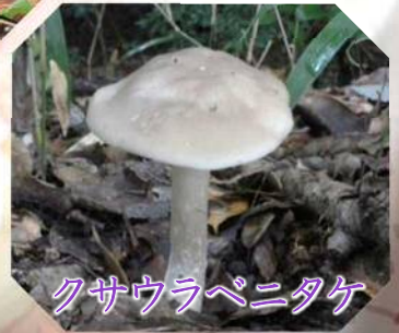
クサウラペニタケ