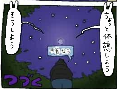
【67日目】キウイとリンゴ