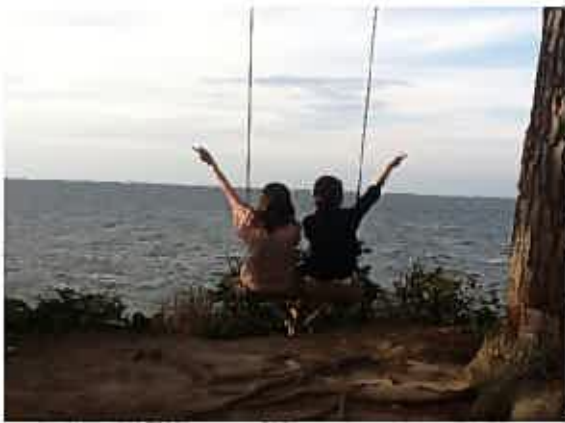
釣りまで一緒にしちゃいました。