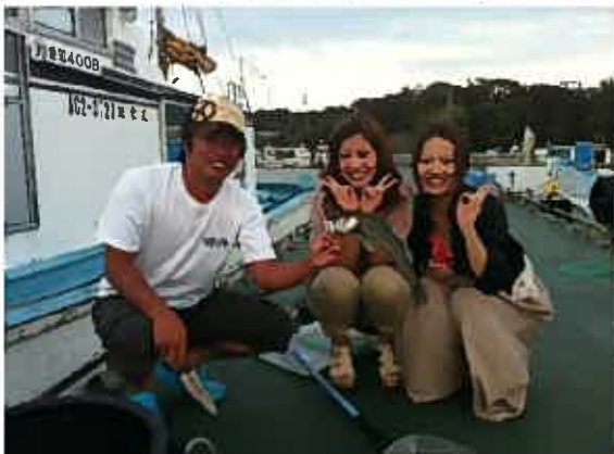
ふたりはしっかり釣ってました☆