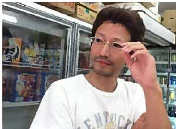
↑イケメン八百屋さん

(道が入り込んでたので、案内してもらったものの、 行き方がわかりません(><))