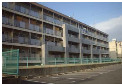
公営住宅等ストック総合改善事業 整備イメージ(耐震改修)

愛知県、豊橋市、岡崎市、一宮市、半田市、春日井市、豊川市、津島市、碧南市、刈谷市、豊田市、安城市、西尾市、蒲郡市、江南市、小牧市、稲沢市、新城市、知多市、知立市、尾張旭市、田原市、東栄町