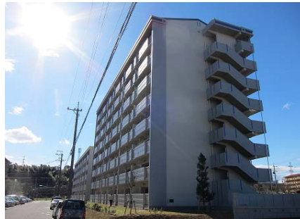
公営住宅等整備事業 整備イメージ