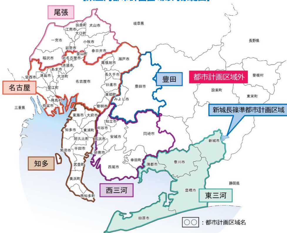
【東三河都市計画区域の対象範囲】