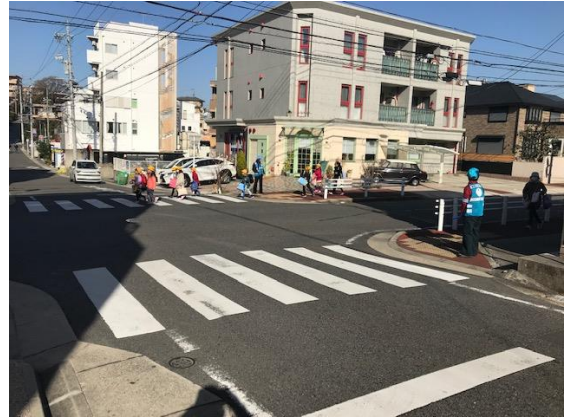
下校児童の見守り