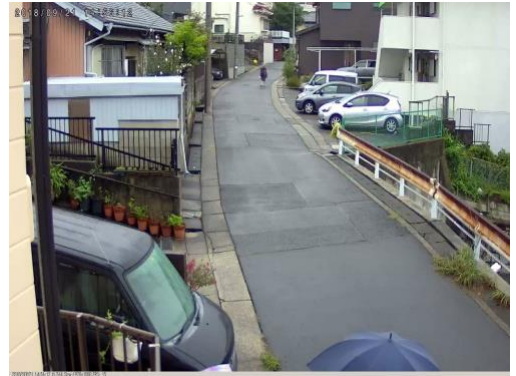
防犯カメラからの画像