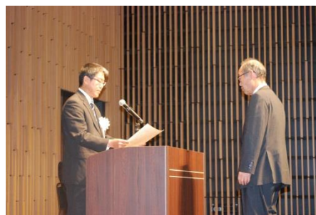
優良家庭教育推進組織の顕彰