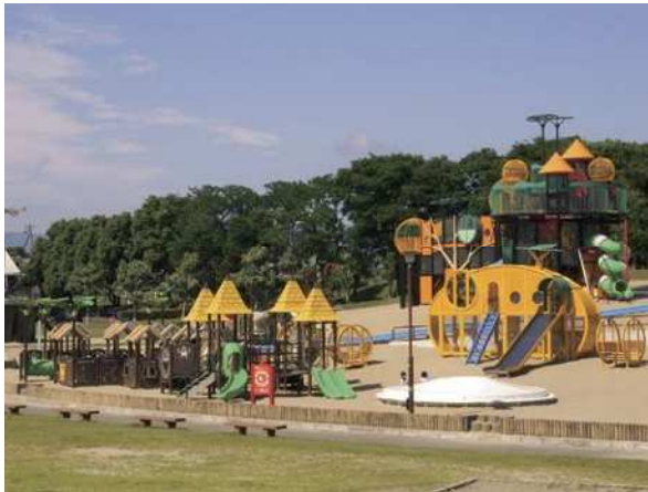
いちよう・ぎんなんランド