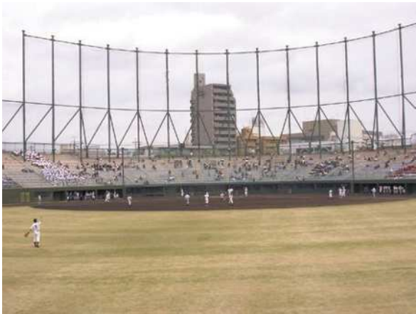
熱田愛知時計120スタジアム