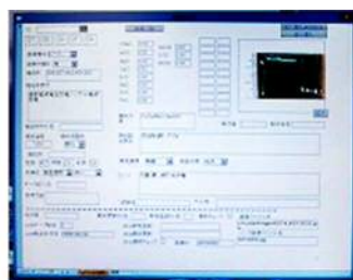
釉薬データベースの閲覧画面

記念講演：釉薬データベースの利用方法 ～名古屋工業技術試験所・ 産業技術総合研究所中部センターの歴史とともに～