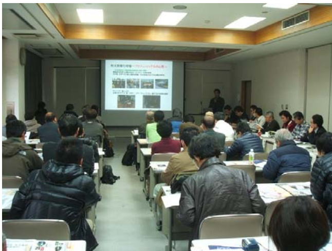
「三河の山里 現地見学ツアー」説明会