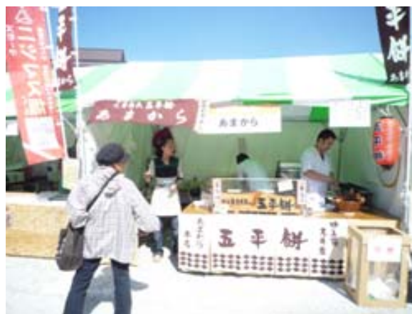
奥三河五平餅サミット