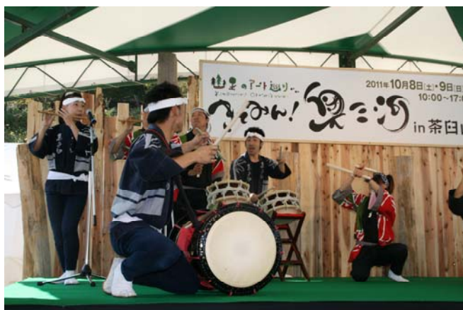
きてみん！奥三河 in 茶臼山