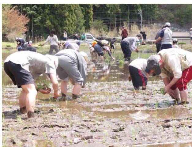
都市住民との交流イベントの様子（田植え）