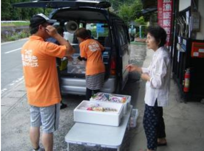
“生き生き号”による宅配サービス (新城市作手地区)