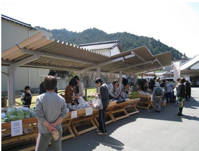
中馬なごやか市の様子