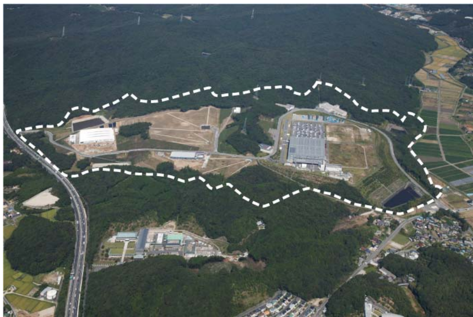
岡崎東部工業団地