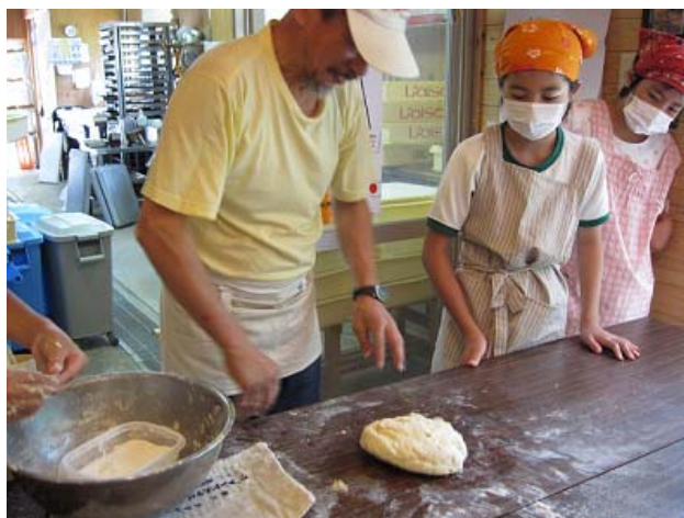
パンづくり体験（豊根小学校）