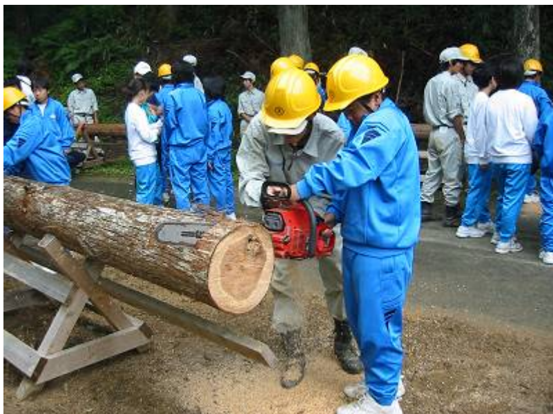
連携型中高一貫教育 サマーセミナー（北設楽郡） （上：丸太切り） （下：授業風景）