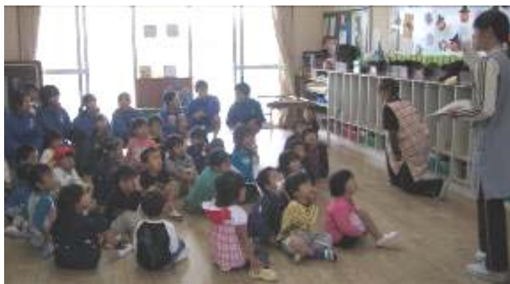
保育園職場体験学習 （新城市千郷中学校）