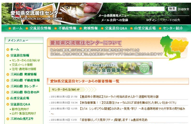
愛知県交流居住センターのホームページ