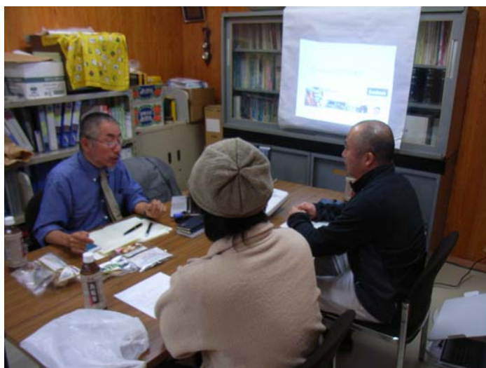
特産品PRに係る講習会