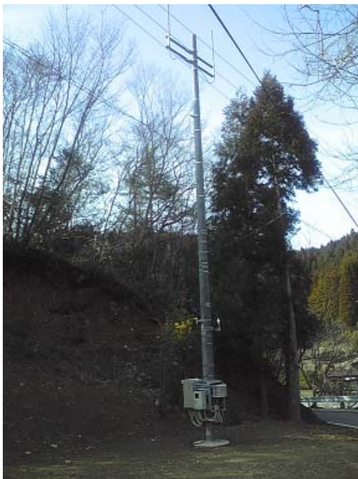
新設された携帯電話基地局 (新城市作手守義小田)