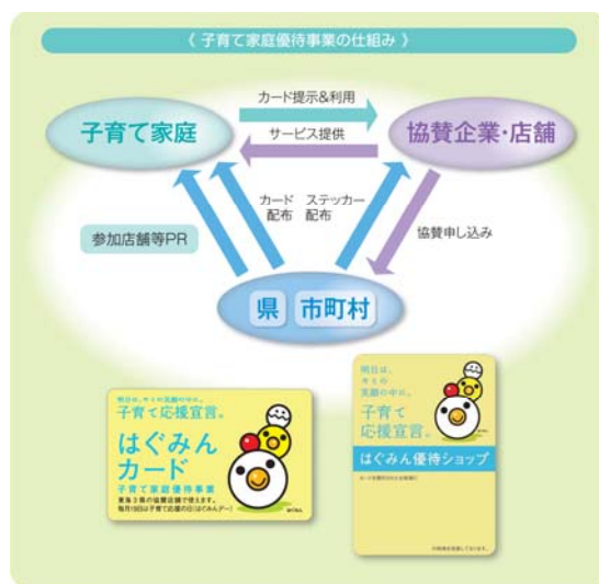
子育て家庭優待制度の仕組み