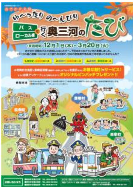
利用促進キャンペーン