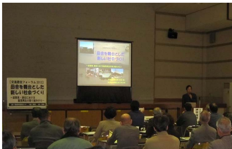
交流居住フォーラム (設楽町)