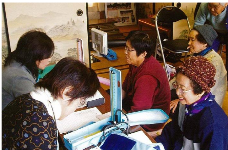
集落支援員の活動（豊田市萩平町）