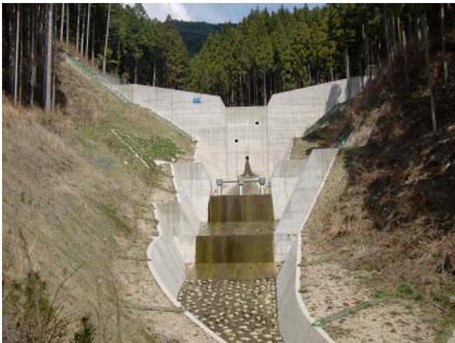
新たに整備された堰堤（矢作川水系：豊田市黒田町）