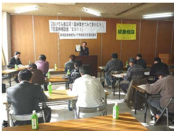
就農相談会の様子（新城市）