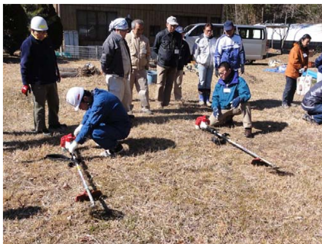
「三河の山里一草刈応援隊」活動