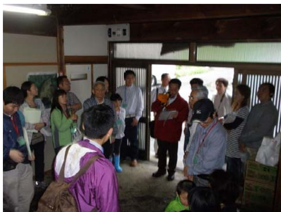
空き家・空き地見学ツアー（新城市）