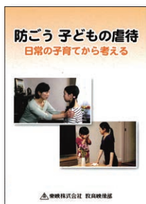
(25分) (2015年) (字幕付き) No.158