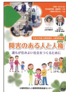
(33分) (2019年) No.162