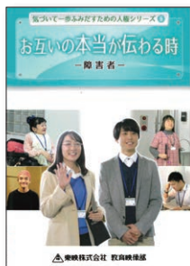
(24分) (2018年) (字幕・副音声付き) No.157