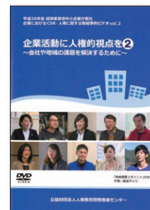
(96分) (2019年) No.161