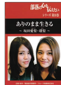
(24分) (2017年) (字幕付き) No.160