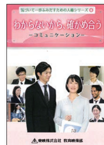
(29分) (2018年) (字幕・副音声付き) No.159