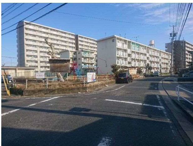
敷地南方より調査対象地（11、12号棟）