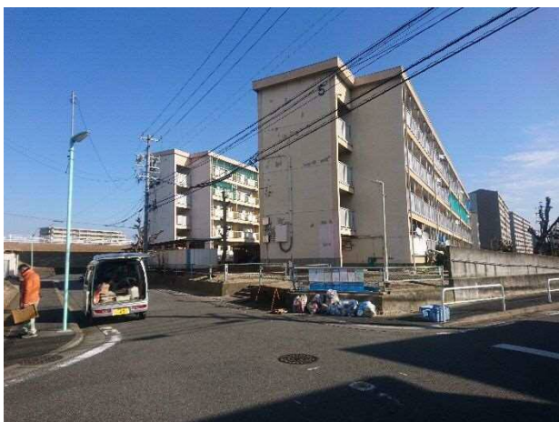
南西方より調査対象地（5、2号棟）