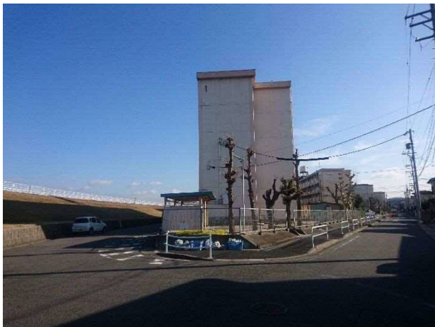
西方より調査対象地（1号棟）