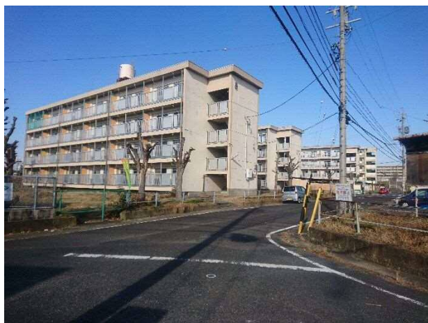
敷地南方より調査対象地（8、7号棟など）