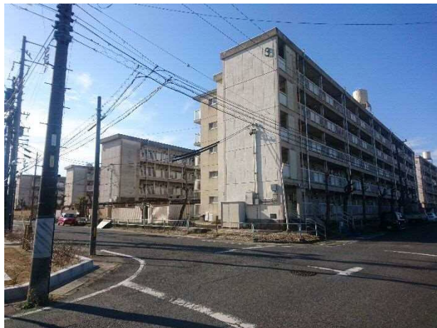
北東方より調査対象地（3、6号棟など）