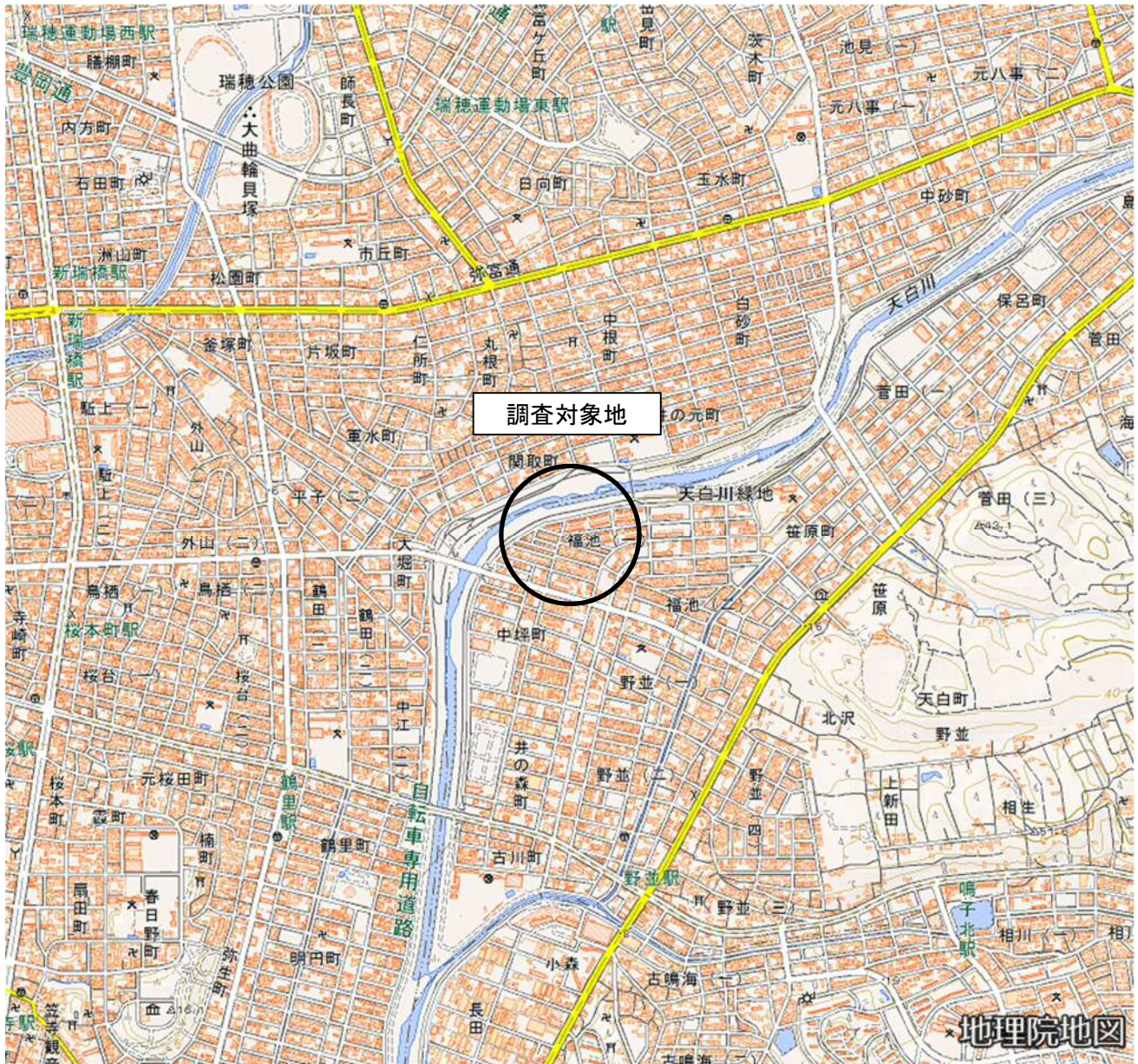
<調査対象地位置図>