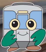
愛環マスコットキャラクター あるるくん