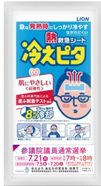
冷却ジェルシート