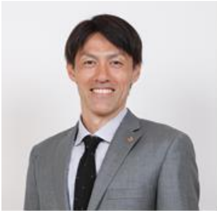
名古屋グランパス クラブスペシャルフェロー 榎崎正剛さん（43歳）

名古屋グランパスで20年間プレーし、2018年に引退した元プロサッカー選手。ポジションはゴールキーパー。元日本代表でFIFAワールドカップに4大会連続で選出。引退後は名古屋グランパスのクラブスペシャルフェローに就任し、後進のGK育成やグランパスの渉外・広報活動に従事。