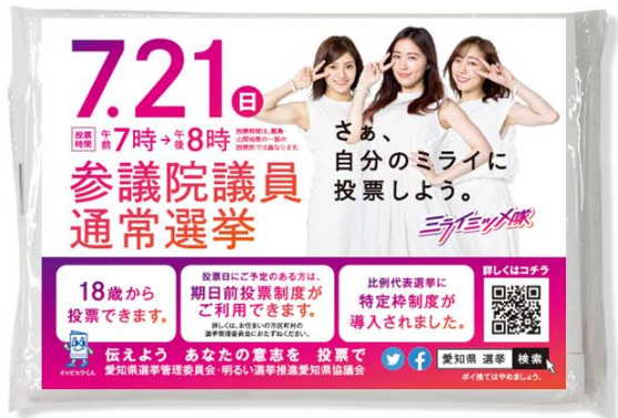
ポケットティッシュ