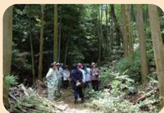
* 結いの里庭周辺チェック *