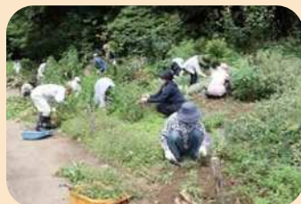
* 庭の手入れ *