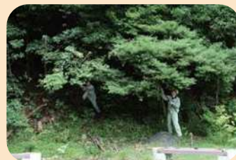
* 樹木の伐採 *