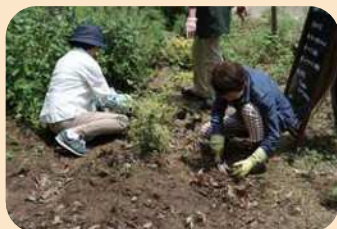
* 持ち寄り苗の植え付け *