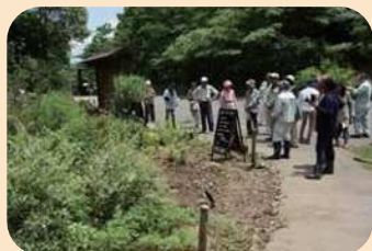
* 作業の確認 *

結いの里庭に移動し、庭の手入れ(草取り等)、剪定、持ち寄り苗の植え付け、樹木の伐採などを行いました！