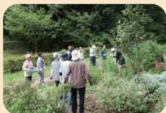
* 剪定方法の確認 *