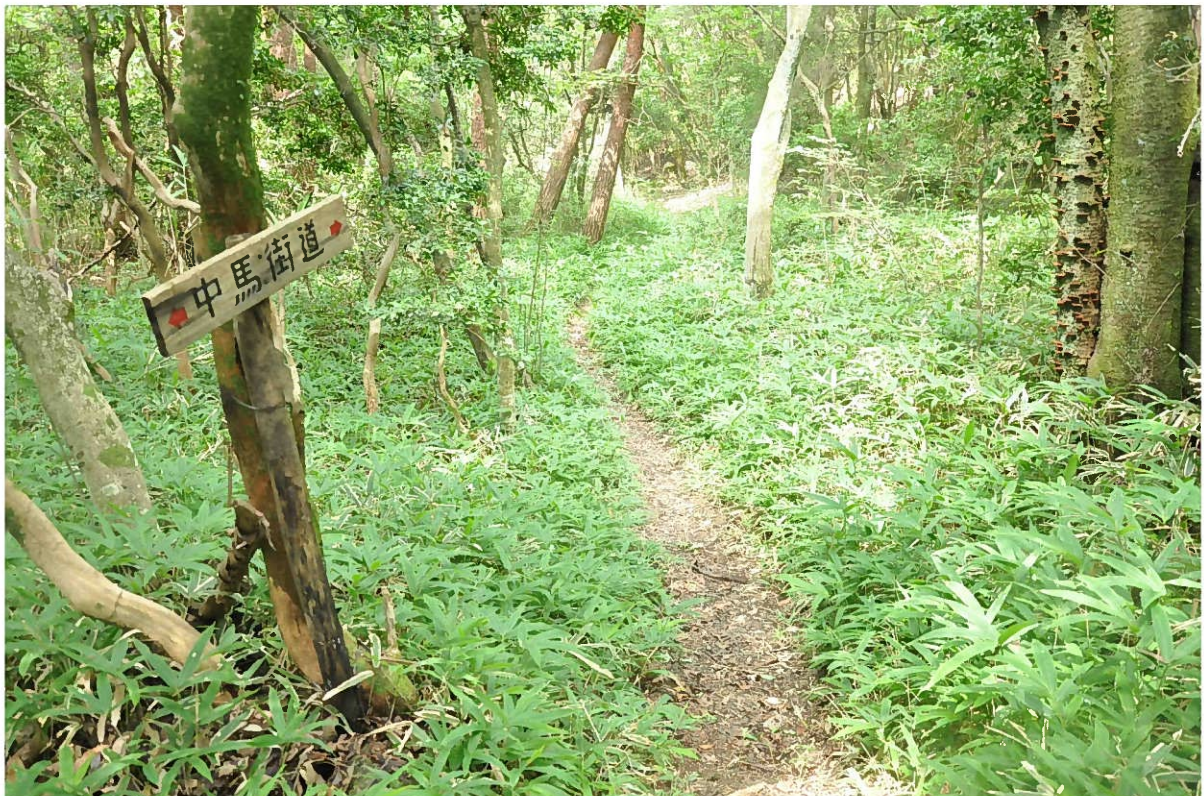
信州飯田街道

馬子唄に唄われた急坂難所の坂瀬坂から国境の雨沢峠に至る道は往時の状況を良好に残す部分もみられる。