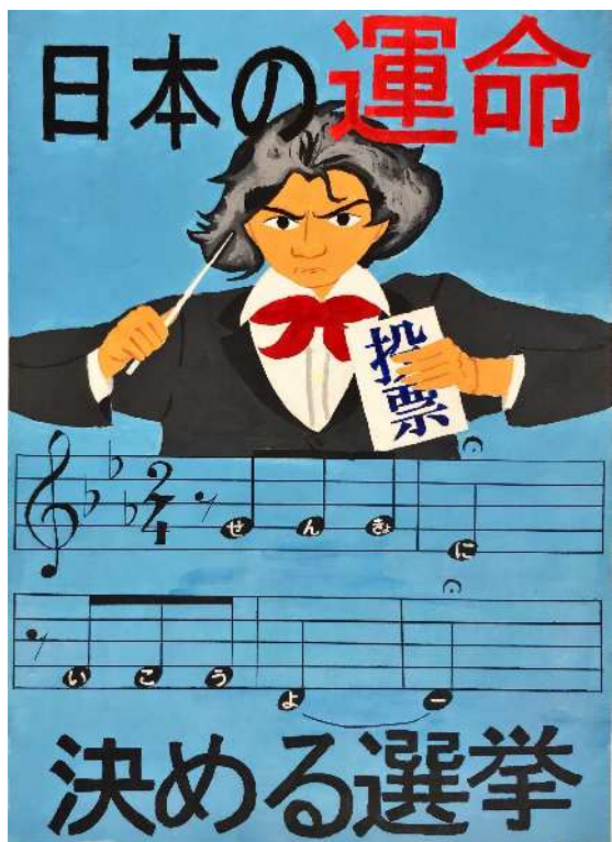
学校法人滝学園滝中学校 1年