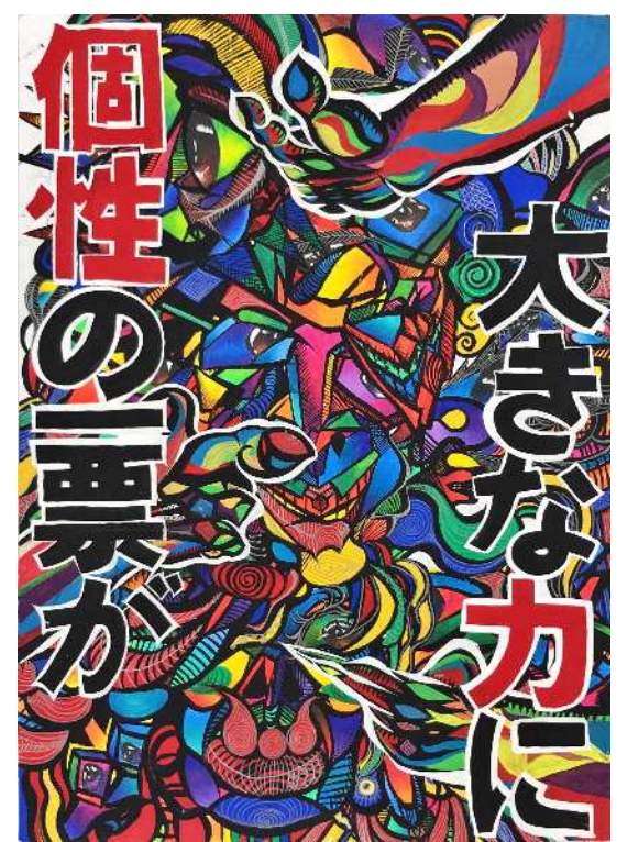
山本学園情報文化専門学校高等課程 2年