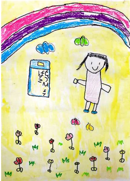
南知多町立篠島小学校 1年