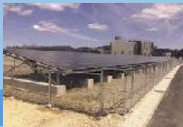
新エネルギー実証研究エリア