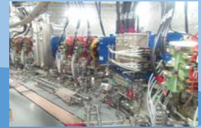
あいちシンクロトン光センター

【参考】知の拠点あいち重点研究プロジェクトⅡ期(2016~2018) 近未来水素エネルギー社会形成技術開発プロジェクト 等3プロジェクト