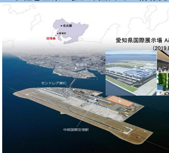
愛知県国際展示場 Aichi Sky Expo (2019.8オープン)