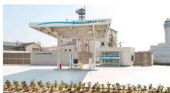
セントレア水素ステーション 東邦ガス提供 (2019.3 開所)