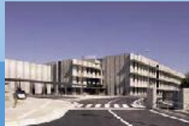
あいち産業科学技術総合センター