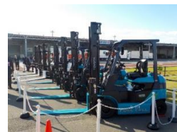
中部スカイサポート(株) ANA中部空港(株)