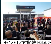
セントレア貨物地区水素充填所(2018.11開所)