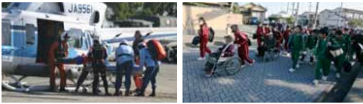
負傷者搬送訓練(第四管区海上保安本部及び田原市消防本部による連携)

このような訓練を積み重ねることにより、どこへ避難するのか、どの道を通れば良いのか、避難経路に危険箇所はないか等、様々なことを確認することができます。そして実際に災害が発生した際には、訓練を活かし迅速かつ的確に避難することができ、多くの方を津波被害から守ることができます。また、訓練に参加できない場合でも、日ごろからこのような事項を確認しておくことが津波から身を守る大切なことにつながります。