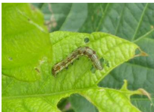
図2 オオタバコガ幼虫と被害葉(ダイズ)

農薬の散布に当たっては、ラベルの表示事項を守るとともに、他の作物や周辺環境への飛散防止に努めましょう。