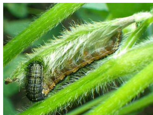
図3 莢(ダイズ)を加害する老齢幼虫