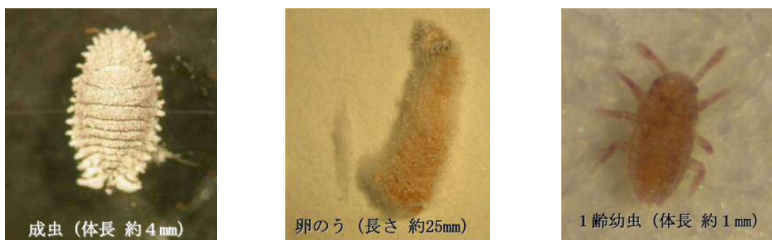
図1 フジコナカイガラムシの成虫、卵のう、1齢幼虫

フジコナカイガラムシの成虫（図1左）、卵のう（図1中央）、2、3齢幼虫はろう物質に覆われ薬液をはじいてしまうため、農薬による防除効果はほとんど期待できません。防除適期は、ろう物質に覆われない1齢幼虫（図1右）の発生時期に限られます。そのため、1齢幼虫発生時期が揃っている第1世代1齢幼虫の発生ピークを把握し、防除することが重要です。