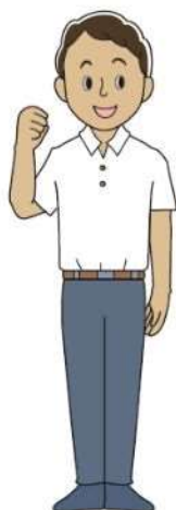
ていん ティンさん