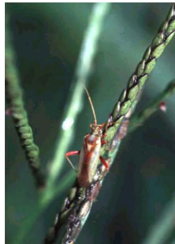
図2 アカスジカスミカメ成虫