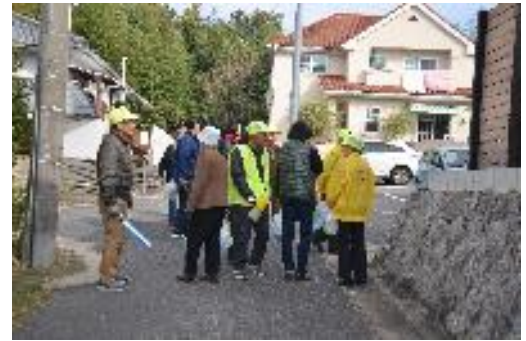
パトロールの様子