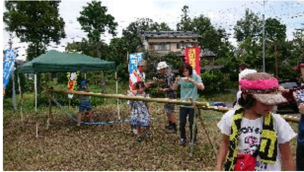
流しそうめんの様子（会場に防犯のぼり設置）