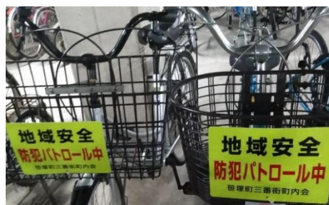
自転車カゴにパネルを取付け