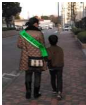
庄内小学校 朝の交通当番往復時パトロール