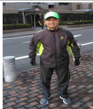
ジョギングパトロール