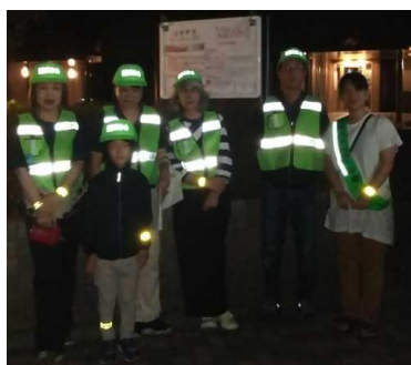
10月5日夜間パトロール

また、夜間、歩道通行時において、街路灯等による明るさが十分あり、より安全と思われる最寄り駅からの帰宅ルートを、町内会が発行する「防犯だより」に掲載し、情報発信も行いました。