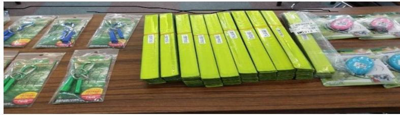
左：LED ライトとホイッスル 中央：反射板 右：防犯ブザー

パトロール中の安全も考慮して、防犯ブザー、反射板、ホイッスルも資材として購入し、安心できる活動に結びつけました。