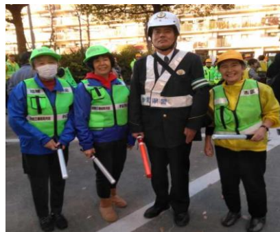
12月10日庄内学区年末パトロール