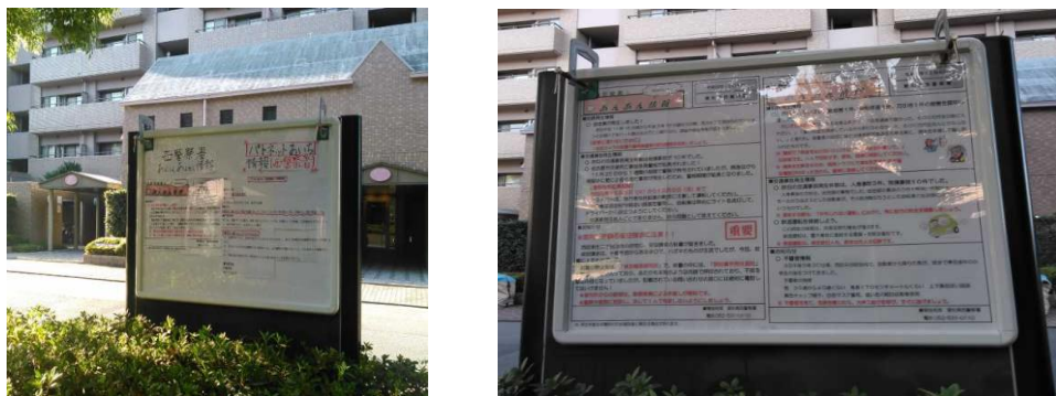
屋外掲示板で犯罪・不審者情報を周知

警察が情報を発信する「パトネットあいち」や「あん・あん情報」を基に、町内会の掲示板を活用して犯罪・不審者情報を広く周知しました