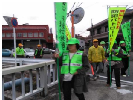
11月24日庄内学区防犯パトロール