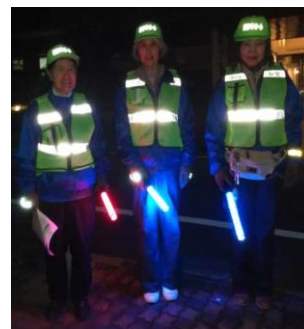
12月7日夜間パトロール