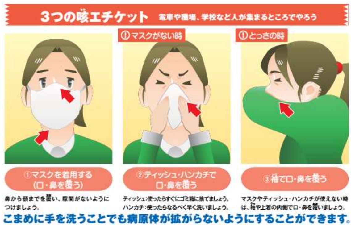
図3 咳エチケットについて