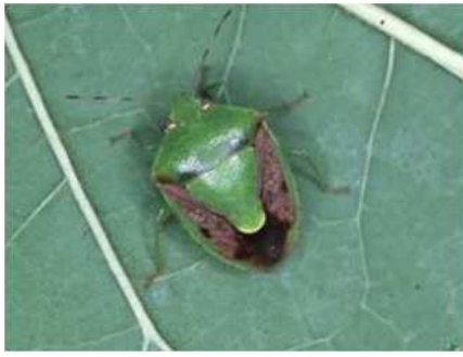
図1 チャバネアオカメムシ成虫