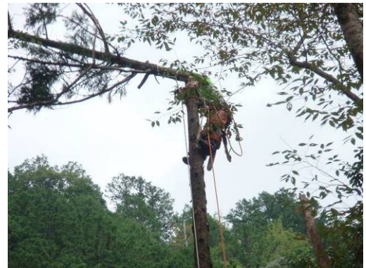
高所作業車を使ったり、高度な伐採技術の実技研修