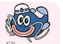
あいち防災キャラクター「防災ナマズン」