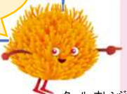
クール・オレンジ