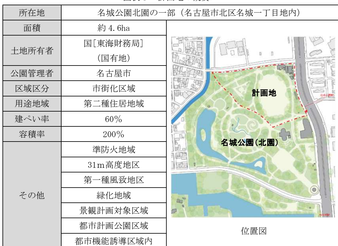
＜図表 3 計画地の概要＞

本事業の予定地は、愛知県新体育館基本計画上の計画地（以下、「計画地」という。）とします。計画地は、名古屋市（以下、「市」という。）が管理する名城公園（北園）内に位置する約 4.6ha の国有地であり、立地条件等の概要は、図表 3 のとおりとします。