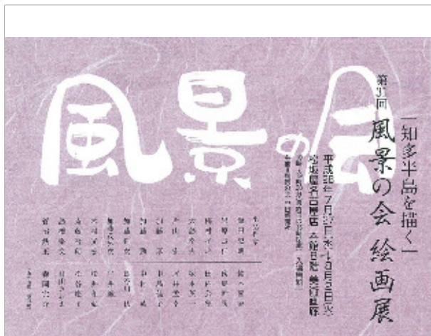
第31回風景の会絵画展 知多半島を描く