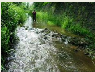
バープエ施工例