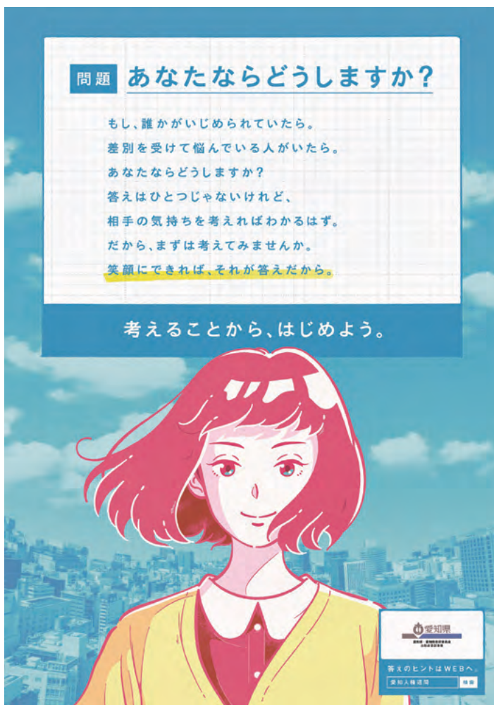
2020年度人権啓発ポスター

人権に対する気づきや、理解を深めていただくきっかけとなるよう、ポスターや新聞広告掲載などにより啓発を行います。