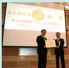
愛知環境賞表彰式