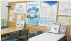
あいち資源循環推進センター