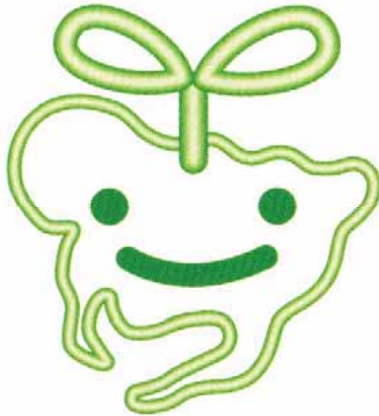
愛知県の資源循環推進シンボルマーク 「メグルくん」