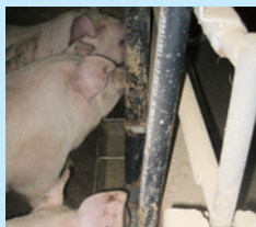
地域食品残渣養豚飼料化推進プロジェクト